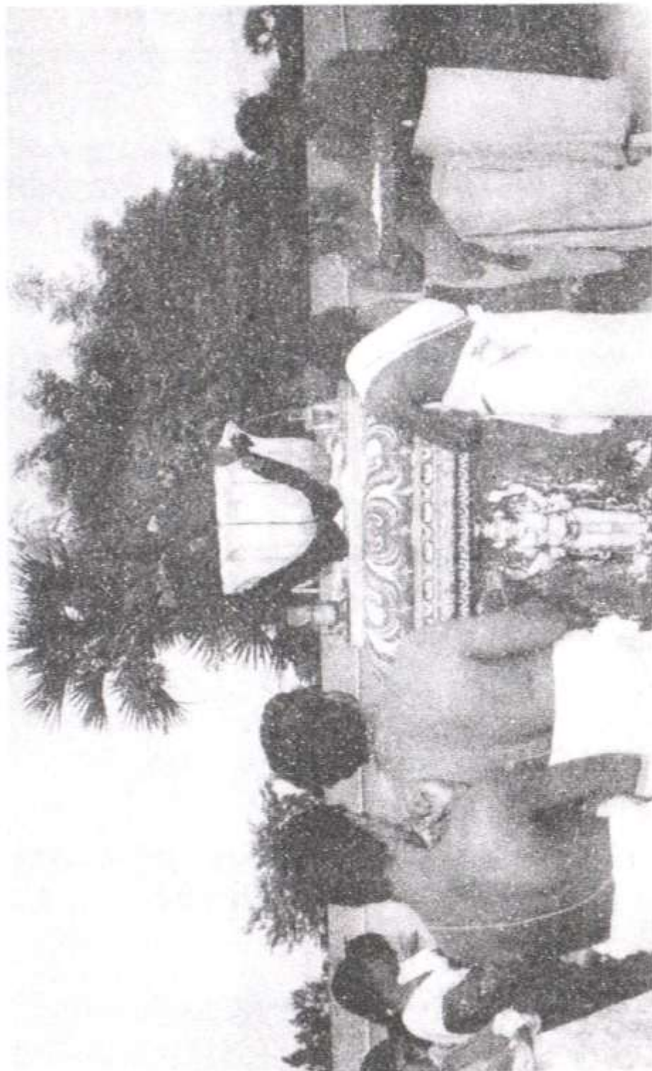
பிருந்தாவன துவாதலி (4-11-95) அன்று நடந்த 'துளஸி கல்யாணம்' காட்சி